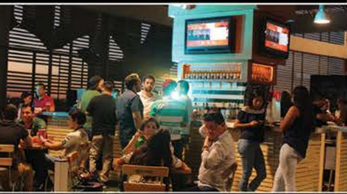
BAR CORONA OCHO TRES

¡MÁS MOMENTOS CONTIGO! CELEBRA TU POSADA EN LA CASA DE LOS GUERREROS